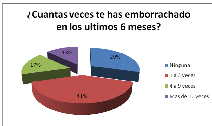
Figura 2: Frecuencia del consumo de alcohol.

Entre los que manifiestan consumir alcohol dos de cada tres encuestados manifiestan haberse emborrachado al menos una vez en los últimos seis meses (71%); el 13% se han emborrachado más de 10 veces (Figura 2)